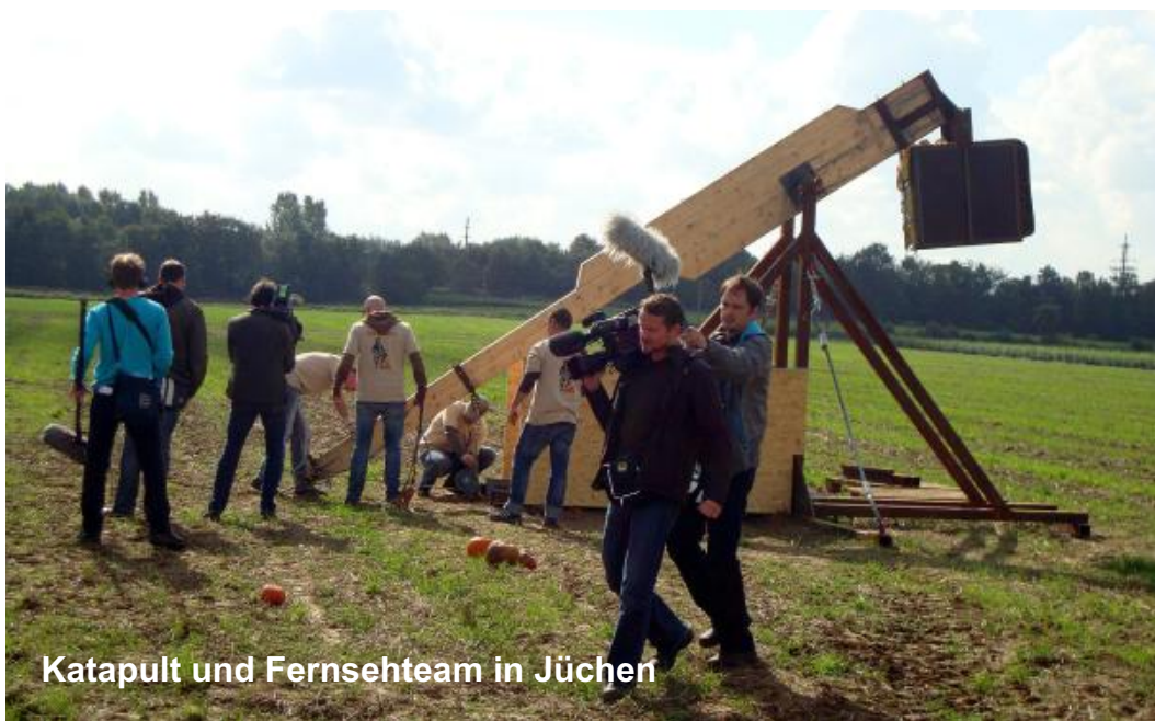
Katapult und Fernseheteam in Jüchen

Das sollten Sie also am 3. Wochenende im September nicht verpassen.