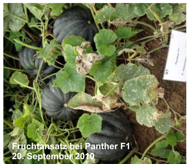
Fruchtansatz bei Panther F1 20. September 2010

Bei den neuen Halloween-Sorten fiel insbesondere die Sorte Champion F1 auf. Champion F1 bildete recht früh die größten Halloweenkürbisse des Feldes. Dabei sind die Früchte wahrlich schön proportioniert, hochrund, leicht gerippt und dunkel orange gefärbt. Ebenfalls sehr gut gefallen hat uns der Riesenkürbis Big Moon , den wir ab dieser Saison anbieten.