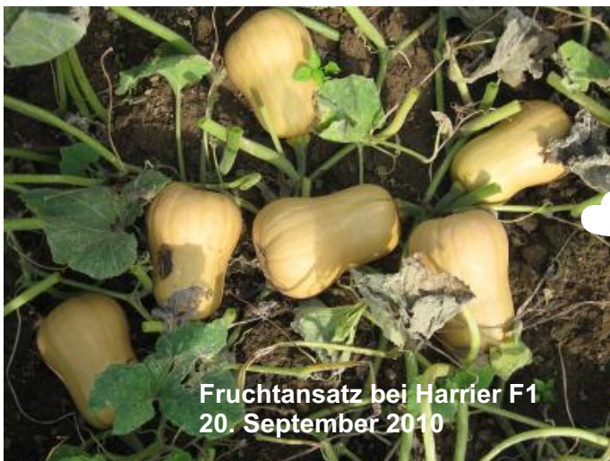
Fruchtansatz bei Harrier F1 20. September 2010

Bereits zum dritten Mal öffneten wir im vergangenen Jahr unser Probefeld auf dem Kürbishof Roelen in Jüchen. Getestet wurden in diesem Jahr etwa 320 verschiedene Partien. Zahlreiche Besucher erschienen dann auch am 3. Wochenende im September um sich über das Sortiment, bewährte und neue Sorten zu informieren.