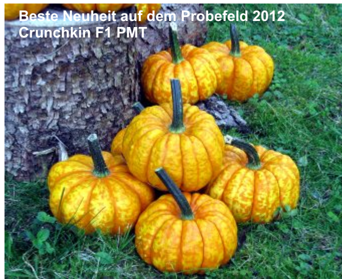
Beste Neuheit auf dem Probefeld 2012 Crunchkin F1 PMT

Um die Realitätsnähe zu wahren und die Vielzahl der kleinen Partien verwalten zu können wurde auch in diesem Jahr wieder direkt aufs Land gesät. Der Ablauf der in der ersten Maiwoche gelegten Samen verlief problemlos, auch die Wachstumsphase zeigte keinerlei Absonderlichkeiten, keine Nässeperiode und keine Hitzewelle. Trotz oder vielleicht auch wegen des für den Standort typischen Witterungsverlaufs waren wir angesichts des guten Ertrages der Partien sehr überrascht.