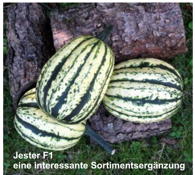
Jester F1 eine interessante Sortimentsergänzung

Eine weitere schöne Ergänzung in diesem Bereich ist Ruffian F1 , ebenfalls eine buschförmig wachsende Sorte in Form und Größe sehr ähnlich der Sorte Sweet Dumpling. Dabei sind die Früchte in Form, Größe und Erscheinung fast identisch dem beliebten Klassiker. Die Grundfarbe ist allerdings eher ein cremegelb, das bei Vollreife in einen Goldton umschlägt. Eine Verkostung der rohen Früchte ergab auch hier eine hohe Ähnlichkeit zu denen von Sweet Dumpling.