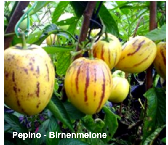
Pepino - Birnenmelone

Geeignet sind die kernarmen Früchte als Dessert und für Marmelade oder Fruchtaufstriche.