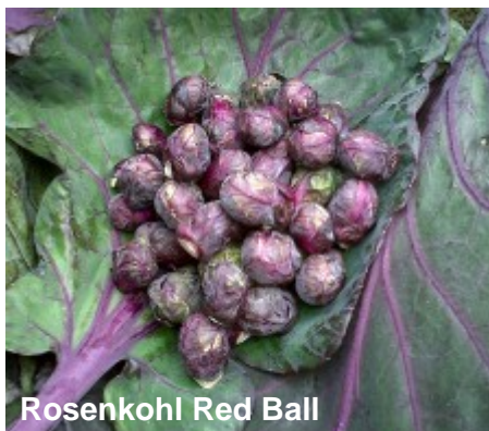
Rosenkohl Red Ball

Auch bei den Kohlgewächsen gibt es immer wieder etwas neues zu entdecken. Kohl gilt bei den einen als langweilig, altertümlich und out, bei den anderen als Trendgemüse mit einer unendlichen Vielzahl an Arten und Rezepten. Aus unserem Sortiment möchten wir Ihnen hier 3 attraktive Neuheiten vorstellen. Red Ball ist ein roter Rosenkohl mit sehr attraktivem milden Geschmack. Kultiviert wird er wie andere Rosenkohlsorten auch, die Erntezeit liegt bei dieser Sorte zwischen Ende September und Ende Dezember. Je kühler die Temperaturen im Herbst werden, desto ausgeprägter ist die schöne rote Farbe. Kalibos ist ein roter Spitzkohl, der sich besonders für Rohkost und Salate eignet. Er wächst recht zügig, fällt locker und hat nur einen kurzen Strunk. Flower Sprout ist etwas ganz neues, ein in 2013 international ausgezeichnetes neues Gemüse. Der englische Züchter hat hier über viele Jahre Rosenkohl und Grünkohl zusammengebracht. Aus den drei angebotenen Sorten bieten wir Ihnen die Sorte Early an, die bei Aussaat März von Oktober bis Dezember geerntet werden kann. Die kleinen an Wirsingköpfchen erinnernden Röschen schmecken herrlich mild mit einem leicht nussigen Aroma. Mehr Informationen, auch Rezepte finden Sie in Englisch und in Deutsch unter : http://www.flower-sprout.com