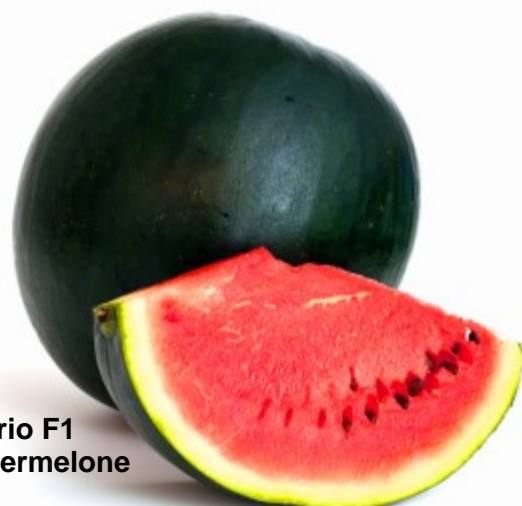
Rosario F1 Wassermelone